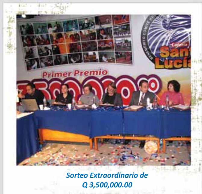
Sorteo Extraordinario de Q 3,500,000.00