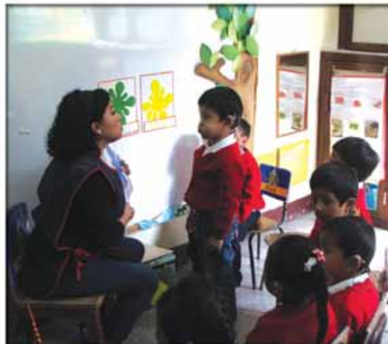
Clases de oralismo Jardín Infantil para Sordos "Rodolfo Stahl Robles"