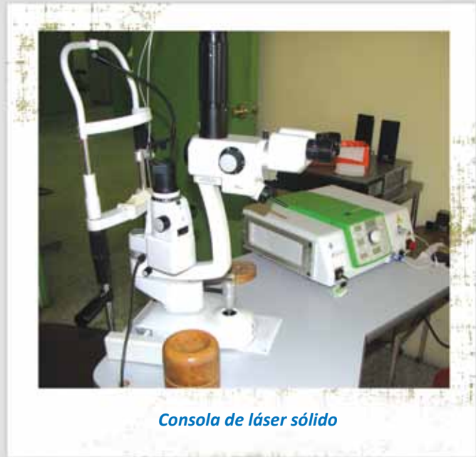
Consola de láser sólido

Dando seguimiento al plan de mantenimiento de todos los centros del Benemérito Comité, se presentan las principales reparaciones y mantenimiento en el siguiente cuadro: