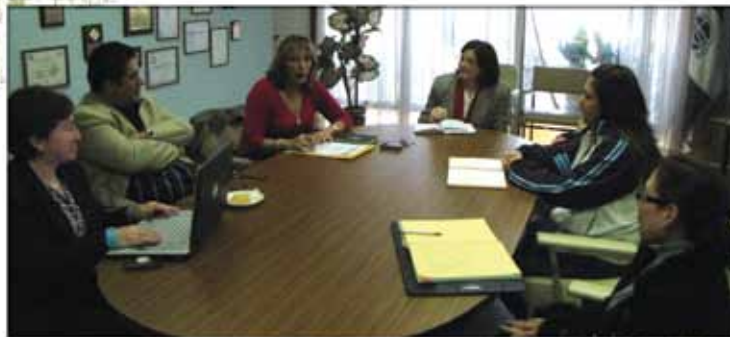
Representantes del Comité atienden a delegación de Christoffel Blindenmission en reunión de coordinación

Cristoffel Blindenmission (CBM) Programa de Prevención de la Ceguera Proyecto permanente para la eliminación de cataratas Proyecto de Baja Visión Proyecto de Tracoma Proyecto de Sub Sede de Banco de Ojos Proyecto de investigación con el Centro de Investigaciones y Docencia