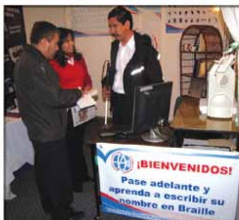
VII Feria Internacional del Libro