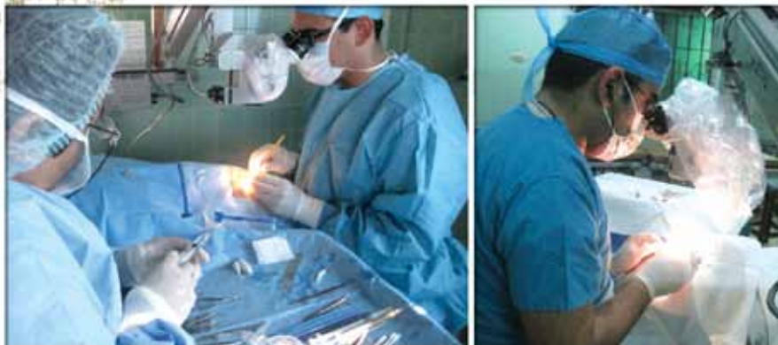
Jornadas quirúrgicas en hospitales regionales

Jornada atención oftalmológica en el Hospital de Ojos “Doctor Fernando Beltranena”, San Pedro Carchá, Alta Verapaz.