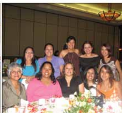
Celebración Día del maestro