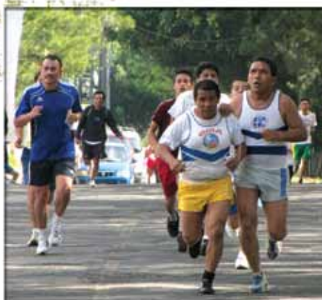
XXI Carrera Internacional de la Luz y el Sonido