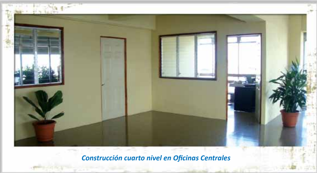
Construcción cuarto nivel en Oficinas Centrales

Se realizó una ampliación en el cuarto nivel del edificio de Oficinas Centrales, consistente en dos áreas de oficina para funcionamiento de Auditoría Interna y Auditoría Externa.