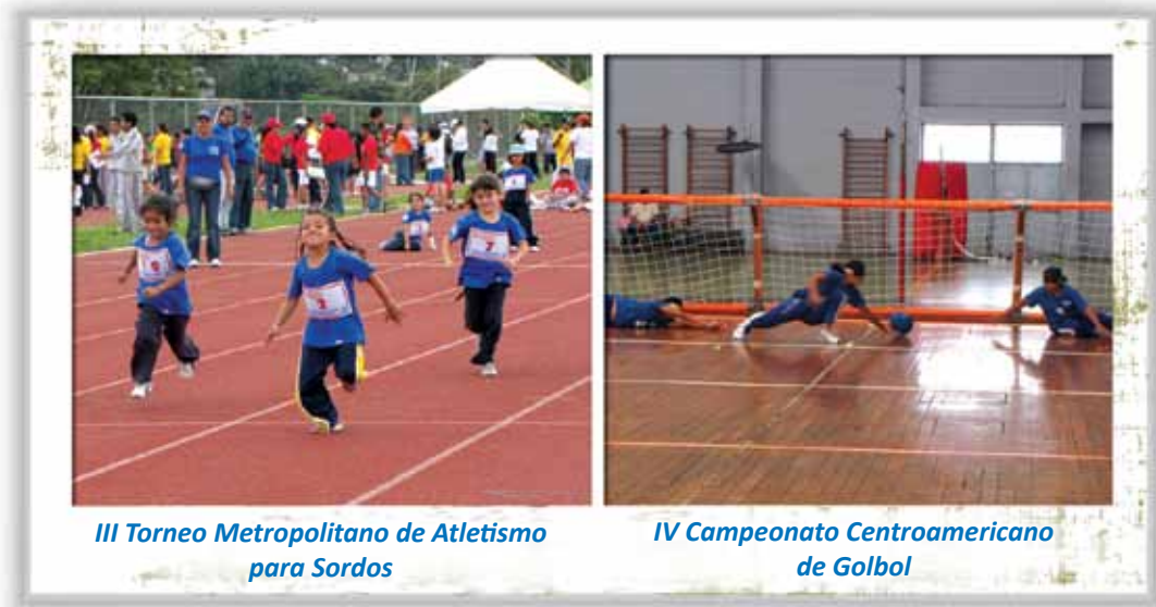
III Torneo Metropolitano de Atletismo para Sordos