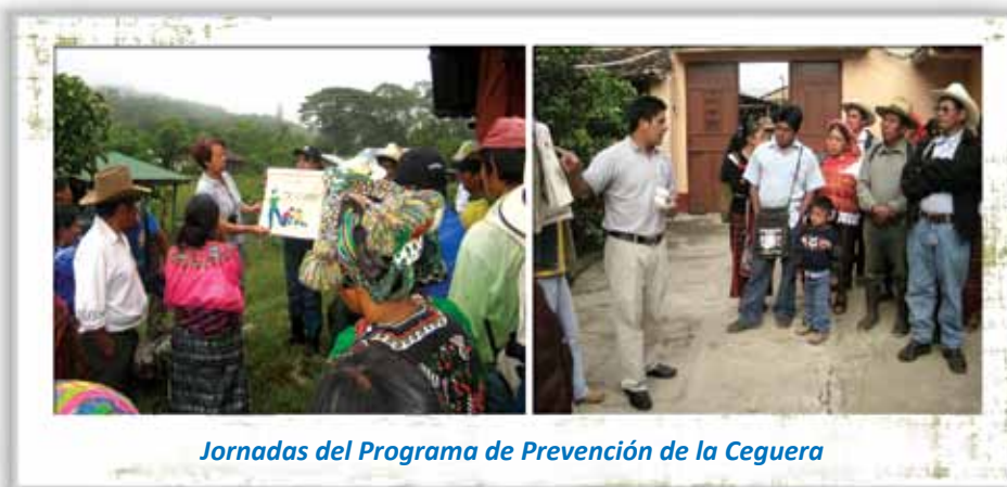
Jornadas del Programa de Prevención de la Ceguera