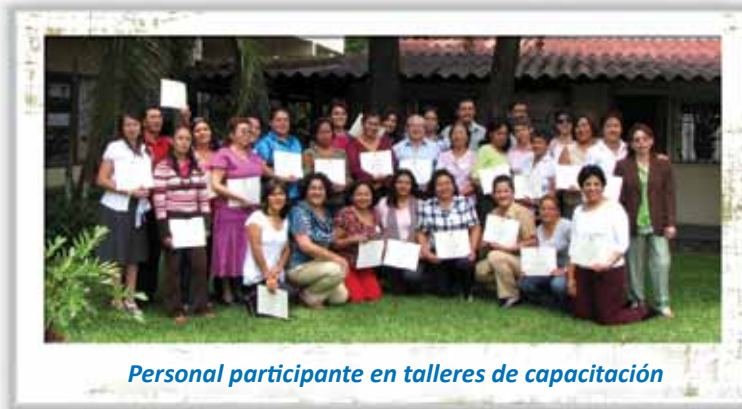
Personal participante en talleres de capacitación