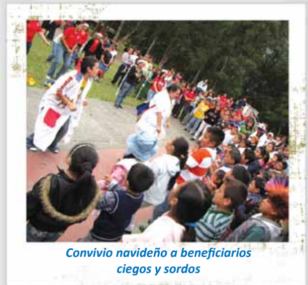
Convivio navideño a beneficiarios ciegos y sordos

Festejo para alumnos ciegos y sordos menores de doce años, de los diferentes centros educativos de la capital, así como para compradores mayoristas no videntes de Lotería Santa Lucía y sus familias realizados en diciembre.