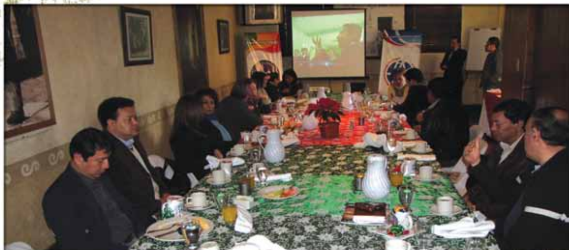
Reunión con representantes de medios de comunicación

Presentación de proyectos del año 2011 a 22 representantes de medios de comunicación.