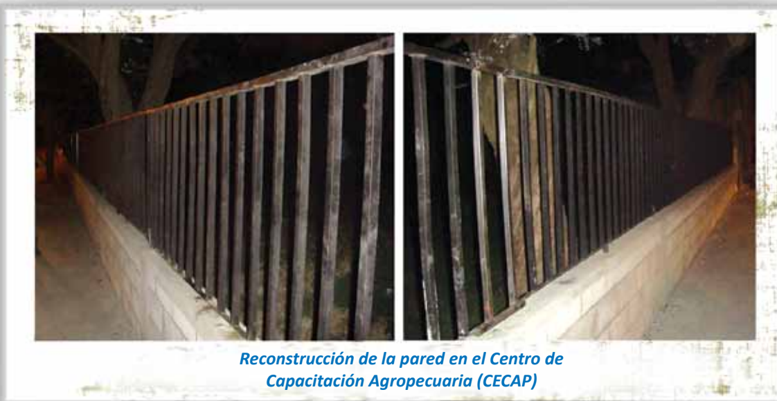
Reconstrucción de la pared en el Centro de Capacitación Agropecuaria (CECAP)