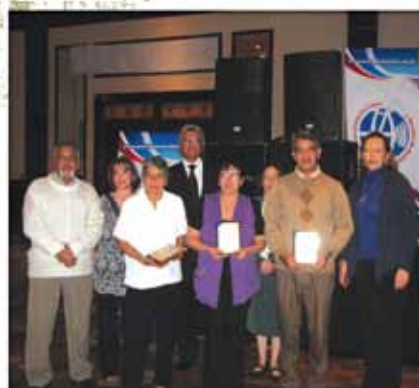
Reconocimiento a trabajadores