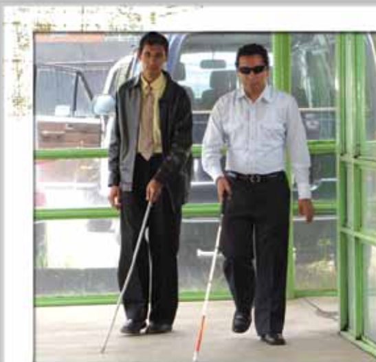
Práctica de orientación y movilidad en Centro de Rehabilitación Integral (CRI)